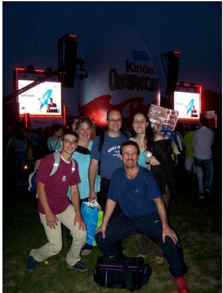
La Bonn Team