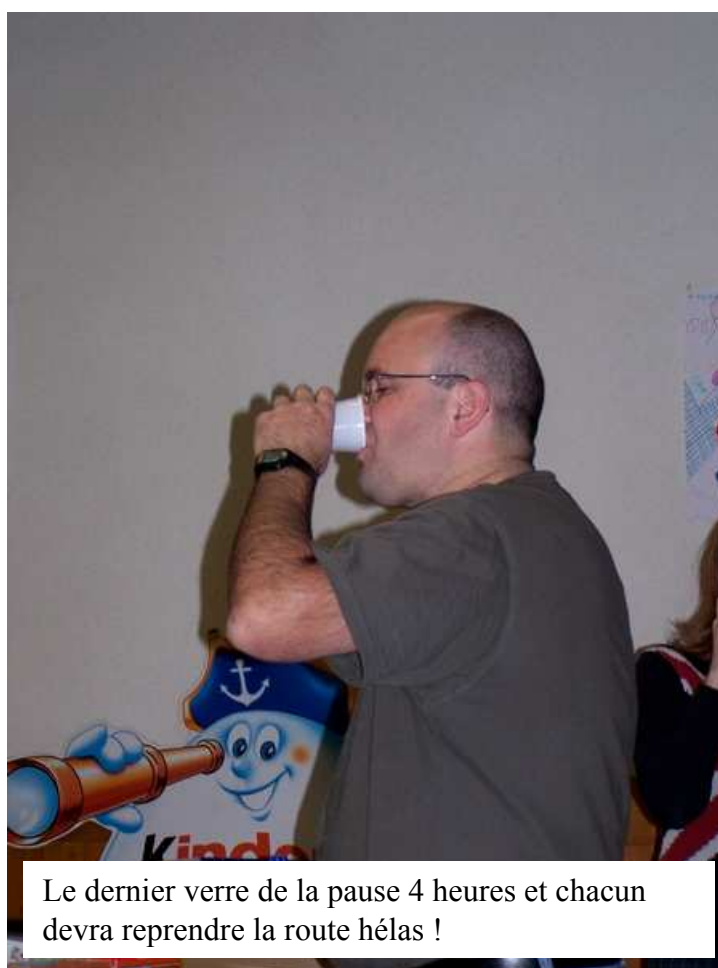
Le dernier verre de la pause 4 heures et chacun devra reprendre la route hélas !