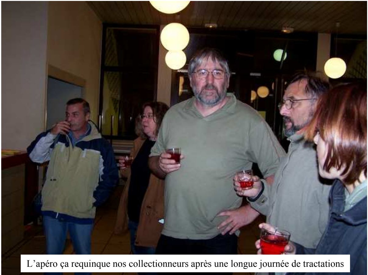
L'apéro ça requinque nos collectionneurs après une longue journée de tractations