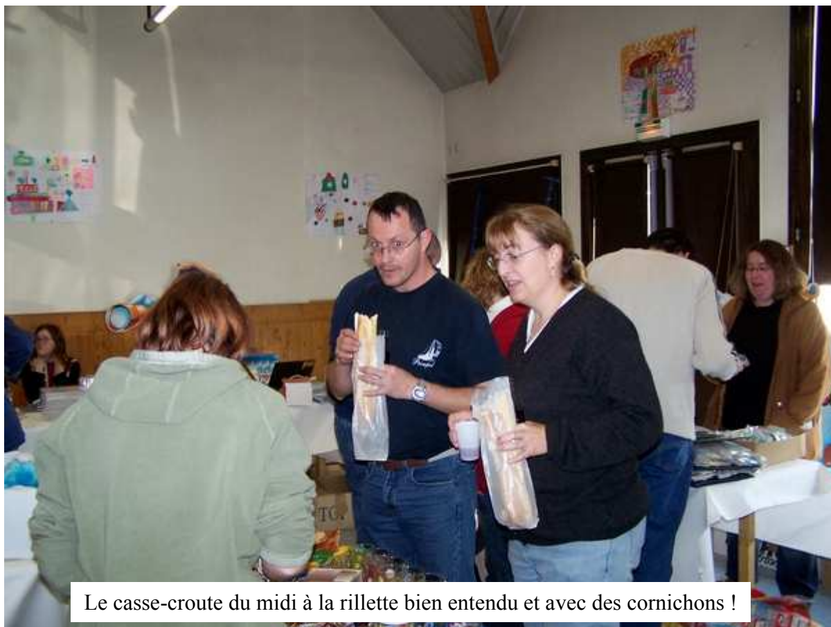
Le casse-croute du midi à la rillette bien entendu et avec des cornichons !