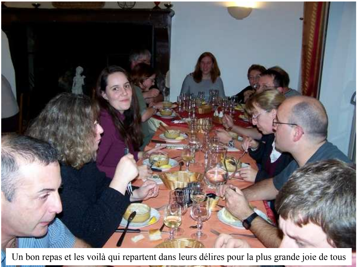
Un bon repas et les voilà qui repartent dans leurs délires pour la plus grande joie de tous